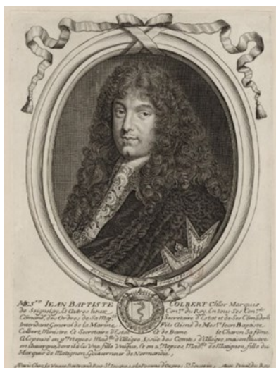
Jean-Baptiste Colbert, marquis de Seignelay Nicolas II de Larmessin, 1680

Jean-Baptiste Antoine Colbert naît à Paris le 1er novembre 1651. Fils aîné de l'autre Jean-Baptiste, le Grand Colbert, et de Marie Charron, il est secrétaire d'État de la Marine de Louis XIV de 1683 au 3 novembre 1690, date de son décès à l'âge de 39 ans.